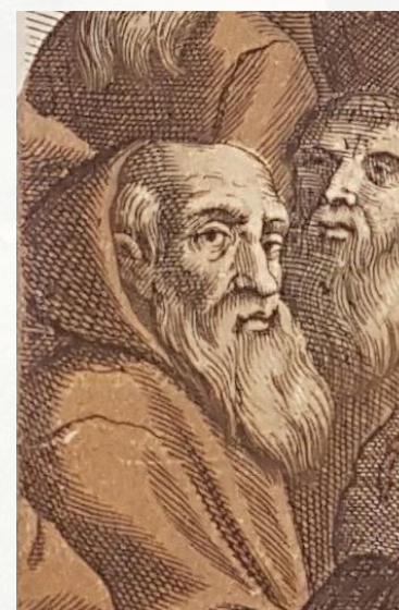
Agrandissement du portrait d'Angélus de Joyeuse.