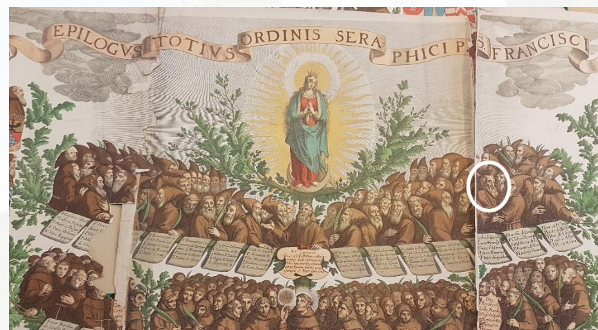
Extrait de l'arbre franciscain d'une lithographie du XIX e siècle. Le portrait d'Angélus de Joyeuse est repéré en blanc.

Les capucins occupent les places d'honneur sur la branche supérieure, la plus proche de la Vierge. Ils sont reconnaissables au port de la barbe, à la bure brune conforme à l'habit de Saint-François, au capuchon long et pointu, à l'origine du surnom que les populations leur avaient donné et qui devint très vite le nom officiel de l'ordre. Dans les petits cartouches on peut lire le nom de chacun d'eux. On retrouve les fondateurs de la réforme comme Mathieu de Basci, des saints ou des bienheureux, également des capucins qui se sont distingués comme « Angélus de Joyeuse ».